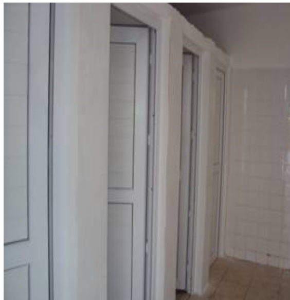
Ahşap kapılar plastik kapıya çevrilmiştir.